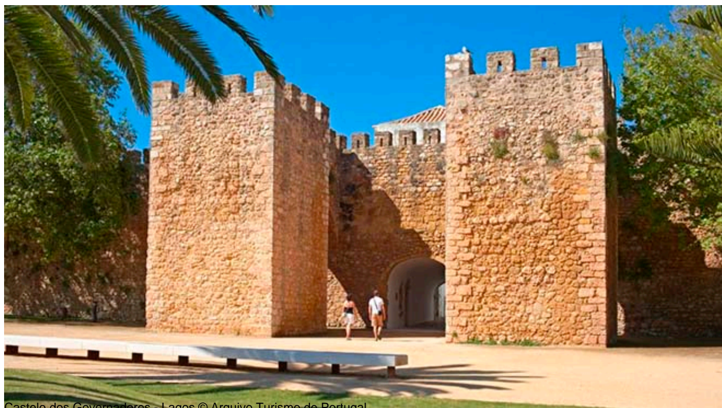
Castelo dos Governadores - Lagos

近くには、障害物がなく完全にアクセシブルなエンリケ航海王子の広場[Praça Infante D. Henrique] (4)から入ることができる サンタ・マリア教会[Igreja de Santa Maria] (3)があります。ただし、入口には段差があるので一人で訪れる際はご注意ください。15世紀にこの教会が完成して以降、復元と拡大が繰り返されてきました。特に18世紀の教会堂などの装飾は一見の価値があります。