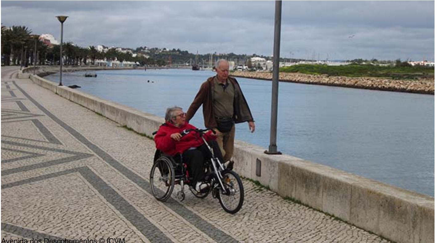
Avenida dos Descobrimentos

海に向かって進むと、 マリーナ・デ・ラゴス[Marina de Lagos] (10)とを結ぶ歩行者橋のある デスコプリメントス通り[Avenida dos Descobrimentos] (8)に戻ってきます。非常に多くの船がマリーナに停泊しており、ポルトガルの旧キャラベル船を模したキャラベル・ボア・エスペレンサ[Caravela Boa Esperança] (9)の姿も見られます。外からも建物の外部の特徴などをご覧いただけますが、入口はアクセシブルではなく、中もスペースは狭く動き回ることが難しくなっています。マリーナには複数のレジャーエリアのほか、ポルトガルの海洋活動について知ることができるアクセシブルな蝋人形博物館[Museu de Cera dos Descobrimentos] (11)があります。