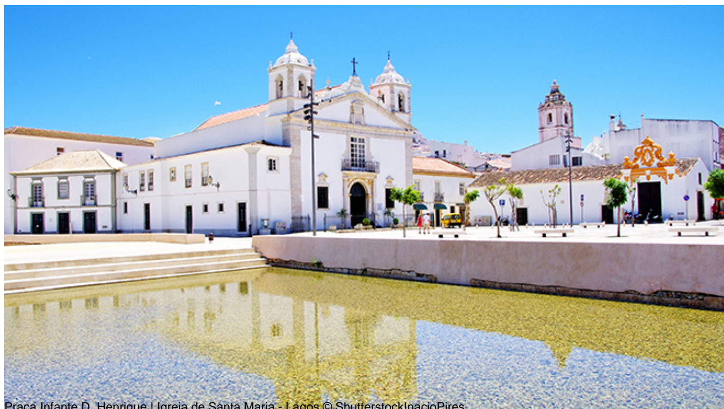
Praça Infante D. Henrique | Igreja de Santa Maria - Lagos

近くには、障害物がなく完全にアクセシブルなエンリケ航海王子の広場[Praça Infante D. Henrique] (4)から入ることができる サンタ・マリア教会[Igreja de Santa Maria] (3)があります。ただし、入口には段差があるので一人で訪れる際はご注意ください。15世紀にこの教会が完成して以降、復元と拡大が繰り返されてきました。特に18世紀の教会堂などの装飾は一見の価値があります。