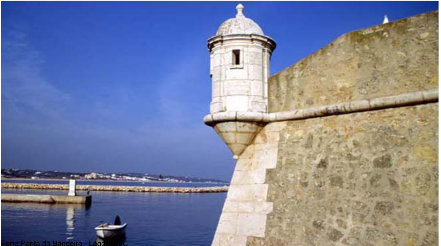
Forte Ponta da Bandeira - Lagos

海に向かって進むと、 マリーナ・デ・ラゴス[Marina de Lagos] (10)とを結ぶ歩行者橋のある デスコプリメントス通り[Avenida dos Descobrimentos] (8)に戻ってきます。非常に多くの船がマリーナに停泊しており、ポルトガルの旧キャラベル船を模したキャラベル・ボア・エスペレンサ[Caravela Boa Esperança] (9)の姿も見られます。外からも建物の外部の特徴などをご覧いただけますが、入口はアクセシブルではなく、中もスペースは狭く動き回ることが難しくなっています。マリーナには複数のレジャーエリアのほか、ポルトガルの海洋活動について知ることができるアクセシブルな蝋人形博物館[Museu de Cera dos Descobrimentos] (11)があります。