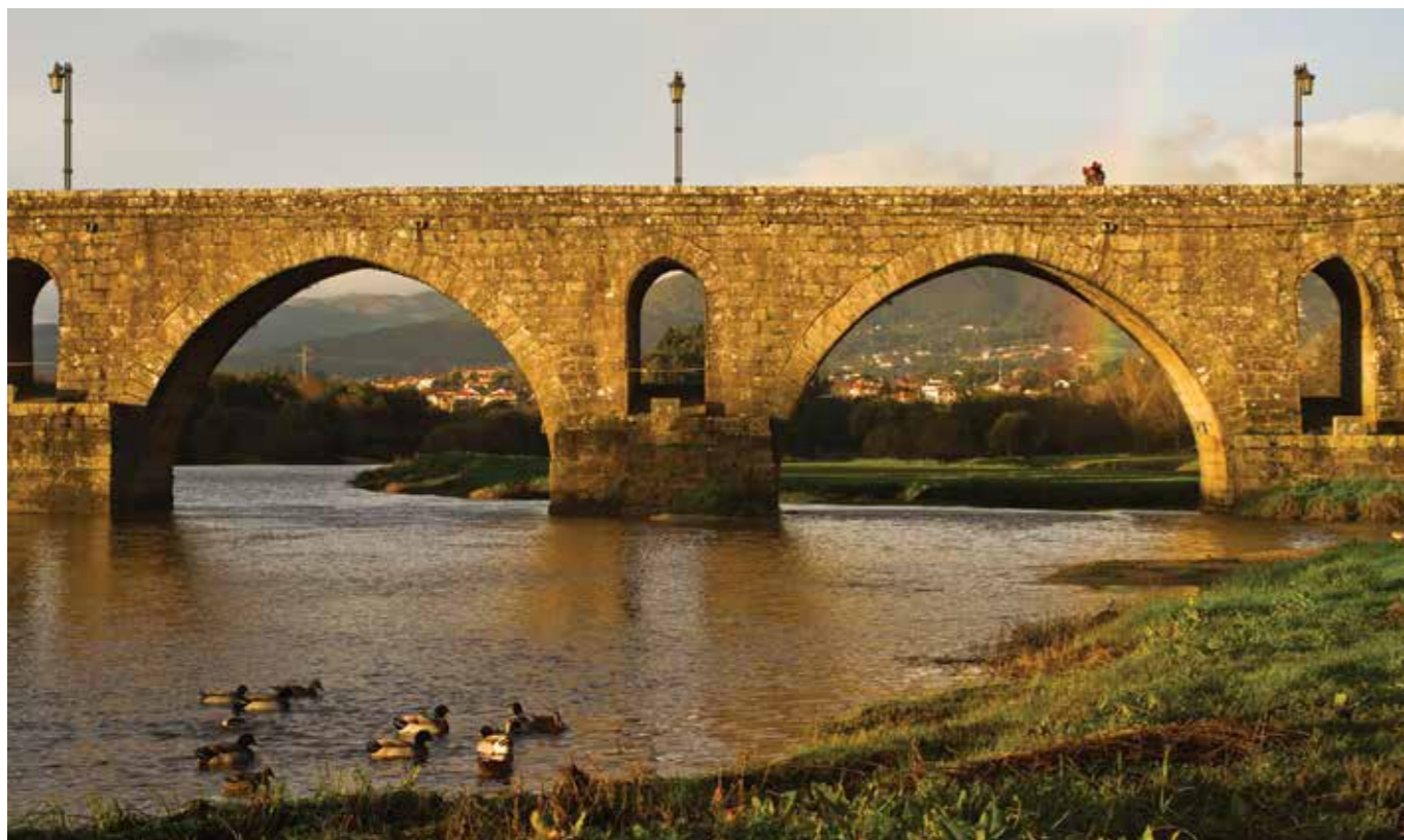
Ponte Romana no Caminho de Santiago, Ponte de Lima