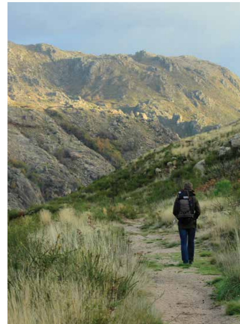
Peregrino no Caminho de Santiago

On arrival in Évora or Ferreira do Alentejo , the routes to Santiago de Compostela took distinct paths: