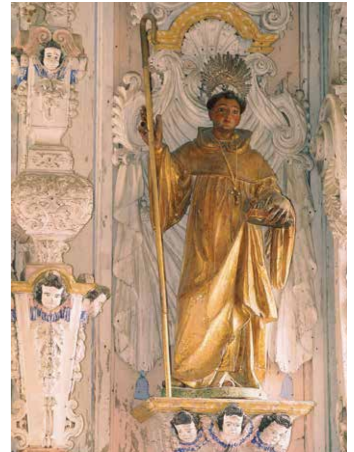
Igreja de Santo António, Tavira

Tavira stands out due to its vast religious heritage of more than 20 churches, among which are the head Church of Santa Maria located in the castle, or the Misericórdia Church. On Easter Sunday in Loulé begins the largest religious manifestation south of Fátima: the Feast of the Sovereign Mother , that lasts 15 days in honor of Nossa Senhora da Piedade (Our Lady of Pity). In Lagos the baroque church of Santo António , with tiles and golden carvings on the walls, is considered one of the most beautiful in the country. Also the São Lourenço church in Almancil receives many visitors due to its walls being fully covered with tiles telling the story of this saint's life. Also the cathedrals of Faro and Silves, both dating back to the 13th cent.. XIII, must be mentioned.