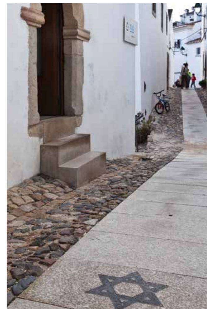
Museu-Sinagoga, Castelo de Vide

The Museum occupies the Synagogue that was ordered to be built between 1430 and 1460 by Henry the Navigator. It is the only remaining 15th century synagogue in Portugal. After the Edict of Expulsion of the Jews in 1496, the building served other functions until 1923 when Samuel Schwarz, a Polish Jew, restored it and donated it to the Portuguese State in order to establish the Museum. Later archaeological excavations discovered the "mikveh", the sacred purification bath.