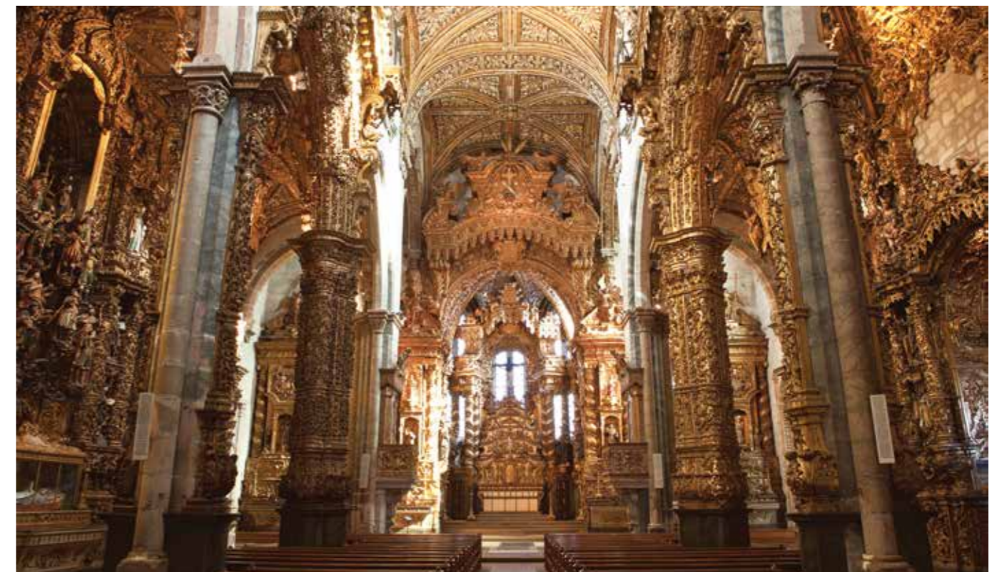
Igreja de São Francisco, Porto

At the Carmelo de Santa Teresa (monastery) it is possible to visit the Sister Lúcia of Fátima's Memorial , the cell where this prophet of the apparitions of Fátima of 1917, lived and later died in 2005. In this cell she received the visit of the Pope Benedict XVI in 1996.