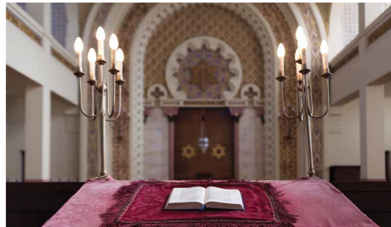
Sinagoga “Mekor Haim”, Porto

Here, there was a Jewish quarter in the Castle district as well as the chapel of Santa Quitéria, which may have been the location of the synagogue. Also, in Freixo de Numão, a nearby village, the “Jewish House” bears marks attributed to the presence of Jews. But the cases filed by the Inquisition against Jews between 1541 and 1763 are the greatest evidence of their presence in these places. During the Napoleonic wars there were several attacks on the New Christians of Vila Nova de Foz Côa who, it was claimed, were allied to the invaders since, with the Declaration of the Rights of Man and the Citizen in France, many Jews from Trás-os-Montes who emigrated there had obtained equal rights for their people.