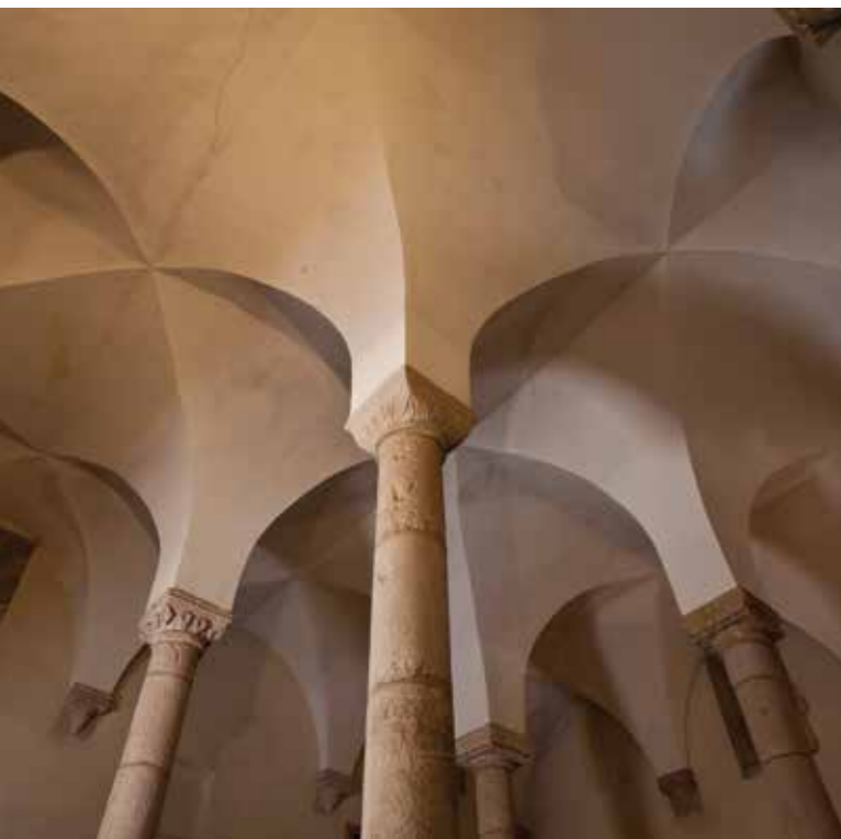
Museu Luso-Hebraico Abraão Zacuto, Tomar