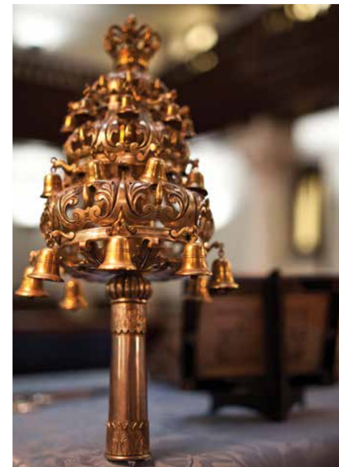
Sinagoga “Shaaré Tikvá”, Lisboa