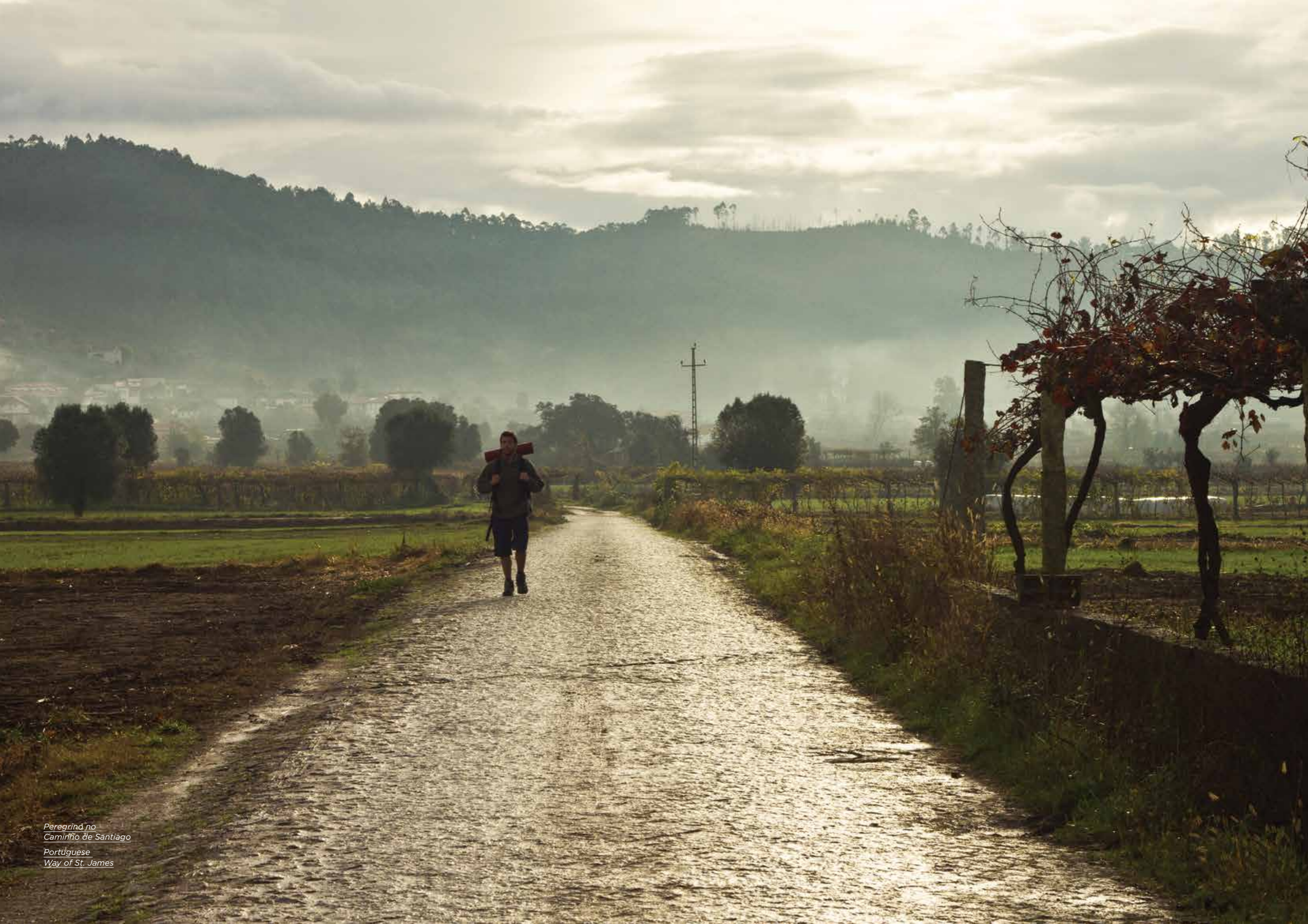
Peregrino no Caminho de Santiago Português Way of St. James